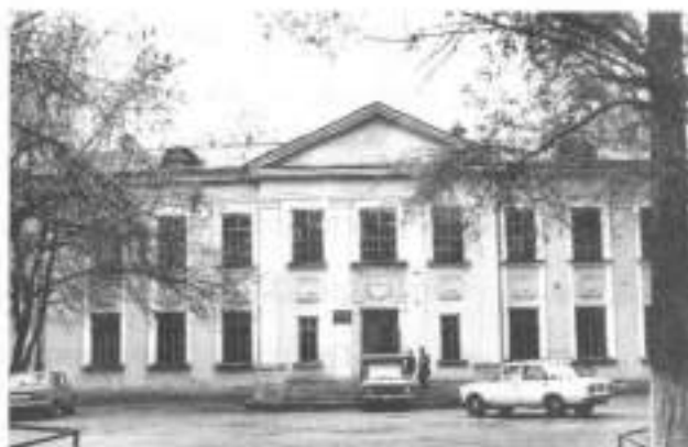
Город Новокузнецк, средняя школа № 10. В годы Великой Отечественной войны здесь размещался эвакогоспиталь № 3625