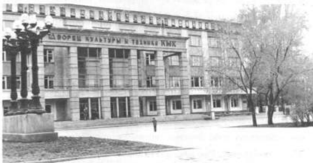
Дворец культуры и техники КМК. В годы войны - эвакогоспиталь № 1242