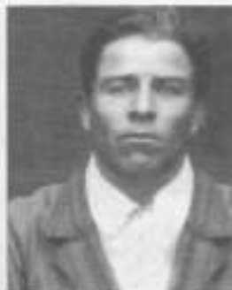
ЧЕСНОКОВ Григорий Гаврилович