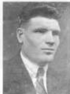
Сурков Алексей Фролович