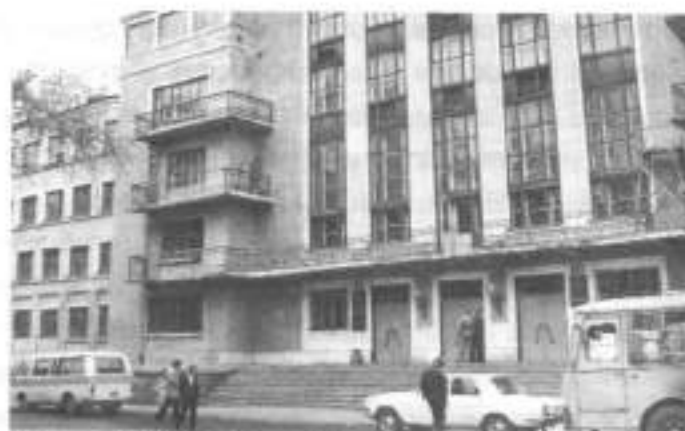
Гостиница КМК на Верхней Колонии. В годы войны - эвакуогоспиталь № 3626