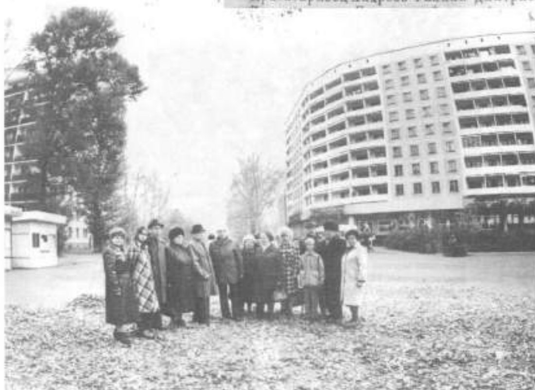
Улица имени Веры Соломиной в Куйбышевском районе Новокузнецка