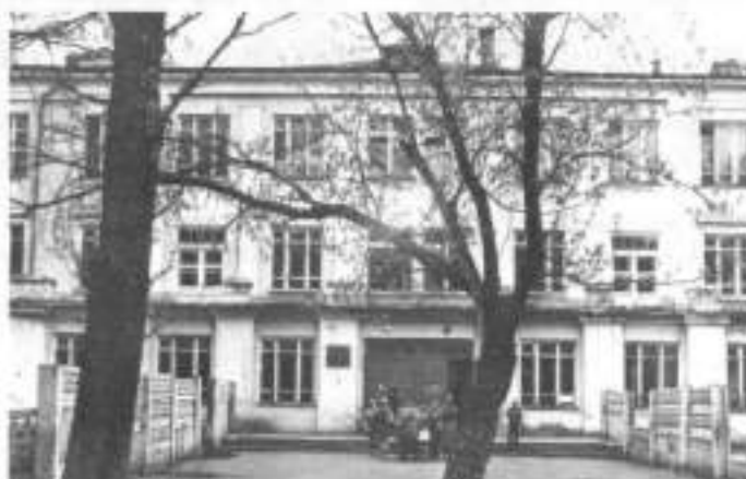
Средняя школа № 11. В ней располагался эвакогоспиталь № 1241