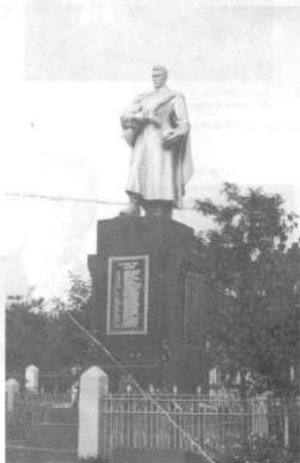
Памятник на братской могиле в п. Борисовка Белгородской области