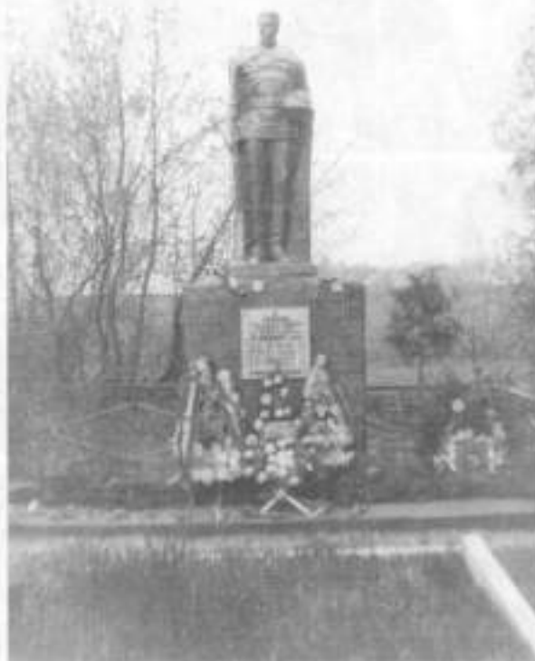
Памятник на братской могиле, где похоронена Юлиа Талабуева

Застывайте папа и мама! Может быть р-на стала писано по тому, что жизнь потекла презреть речку без них изменены, одна Новость моя на одна: совсем было взяли в дивизион ангелы красноармейской песни и * пляски Ное-Нач отменяла. Говорят, что очень долго до письма идут. Когда я дождусь письма И знаю. С приветом Юлиа 31/III-43 Смелый немецкий оккупант! ВОИНСКОЕ Куда Сталинск, Ялтайского края, 20я Транспортная 28 Малабуеву Юлиа Усенофронтбизу. Адрес отправителя 01764-Б Часть Малабуева Юлиа Секция 10