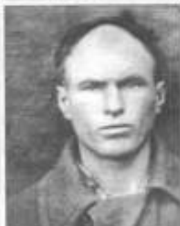
ФЕОКЛИСТОВ Леонид Лазаревич