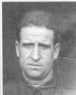
САВЕЛЬЕВ Кузьма Филиппович