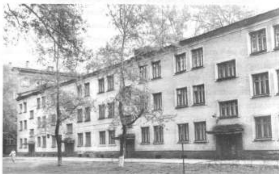
В общежитии студентов металлургического техникума в годы войны находился эвакуогоспиталь № 1247