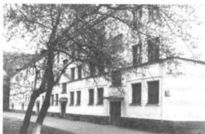
Общежитие педагогического института. В его помещении располагался эвакуогоспиталь № 1241